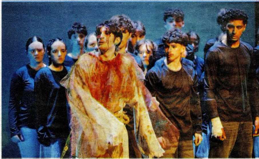
Le groupe des plus anciens en option théâtre.