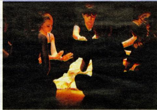
Le premier groupe a participé à la mise en scène.