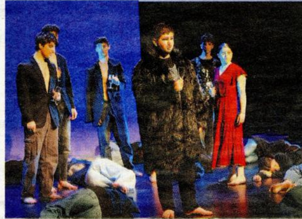
Costumes, éclairages, les élèves ont joué comme des pros.